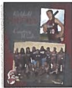
1 - 8x10 SportsMate