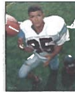
1 - 8x10 Individual