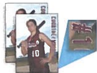
2 - 5x7 Personalized Prints (includes athlete's name & number)