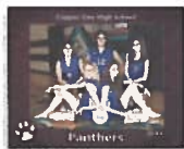
8x10 Bordered Team