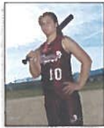
1 - 8x10 Individual