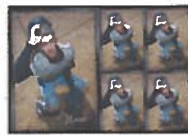
8x10 High Definition Gift Sheet